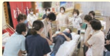
オムツ着用の仕方について