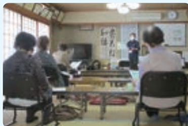
介護保険について