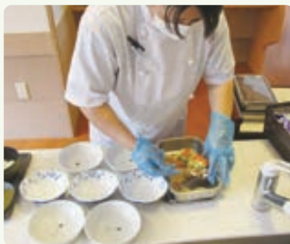
食缶から皿に盛りつけ