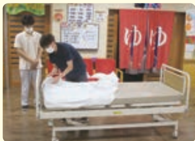
シーツ交換について