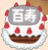
100歳おめでとうございます