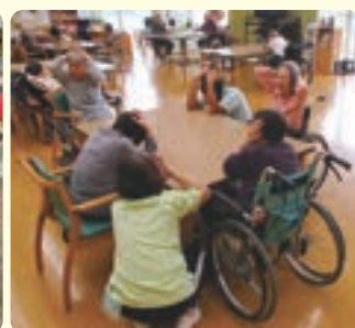
利用者さんも事務所もシェイクアウト訓練中