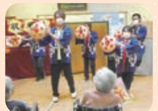
職員出し物「花笠音頭」