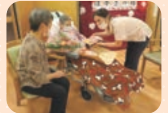
いつまでもお元気で