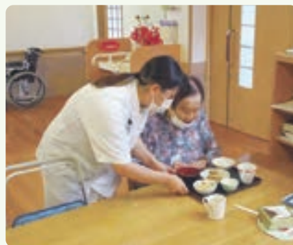
美味しい食事ができましたよ～