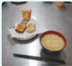
夏バテ防止メニュー