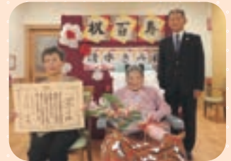
理事長と記念撮影