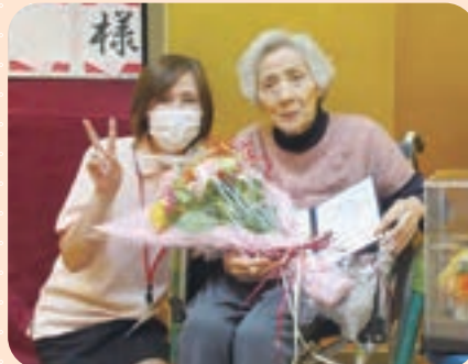
施設長と記念撮影