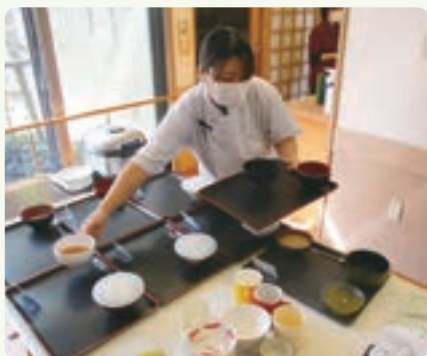
食器の場所を配置中

今年度の目標の1つに「他部署に出向き、専門性を生かして利用者との関わりを持つ事を目指す」という目標を掲げています。まずはふたば館の配膳に取り組んでおり、調理職員として盛りつけや彩りの配置等に気をつけ、今後も他部署から依頼があれば協力していきたいです。