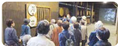
10月 日帰りバスツアー 千光寺、若鶴酒造 見学