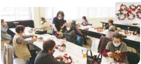
11月 クリスマスリース作り