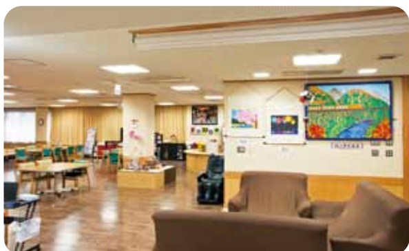
くつろぎスペース